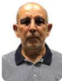
Franco Silva Mobile Phone (tba)