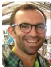
Eduardo Rovisco Telemóvel (TBA)

Os CRO's estarão disponíveis por telefone ou e-mail. crobike.bajaportalegre@acp.pt